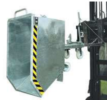
Typ GU verzinkt, mit Rollen