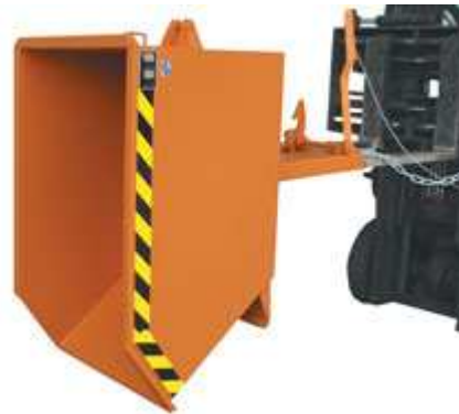
Typ GU in Kippstellung