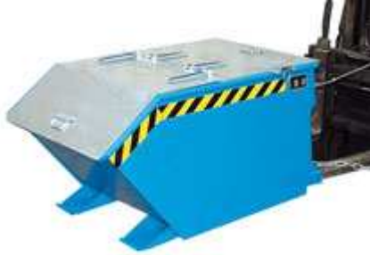
Typ GU mit Deckel

Antriebstechnik - Wälzlager - Reparaturservice